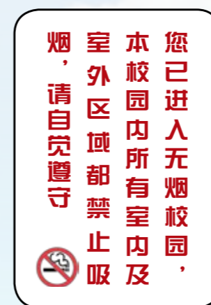
(中等及以下教育机构)